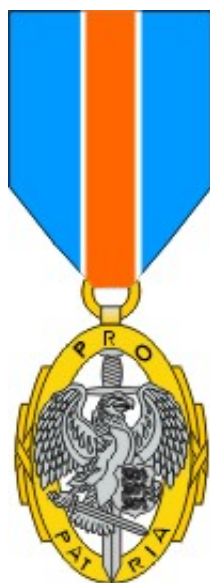
I klass Kaitseliidu kuldne medal