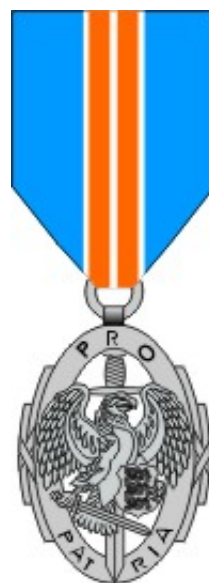
II klass Kaitseliidu hõbedane medal