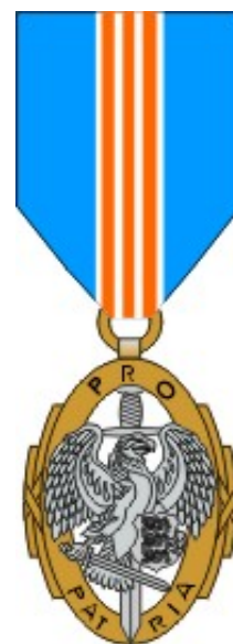
III klass Kaitseliidu pronksist medal