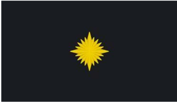
7. Teise klassi vanglainspektori õlakutel kantavad eraldusmärgid