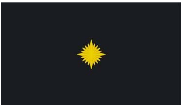
10. Vanglaametnikukandidaadi õlakutel kantav eraldusmärk