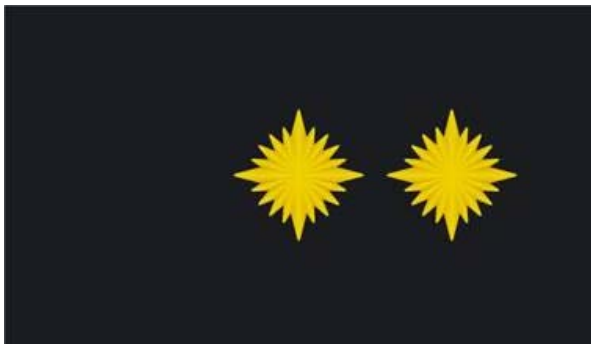
6. Vangla talitusejuhataja, peaspetsialisti ja vanglaametniku ettevalmistusteenistust läbiviiva muu õppeasutuse korrektsiooni erialaõppejõu õlakutel kantav eraldusmärk