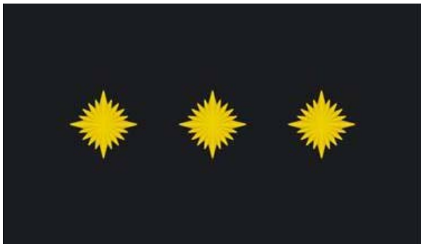
8. Esimese klassi valvuri õlakutel kantavad eraldusmärgid