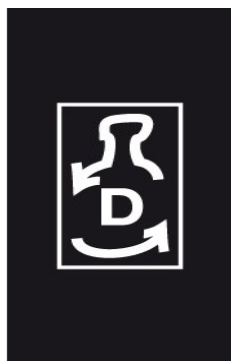
2.5. klaasist korduskasutuspakend