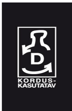
2.6. plastist korduskasutuspakend