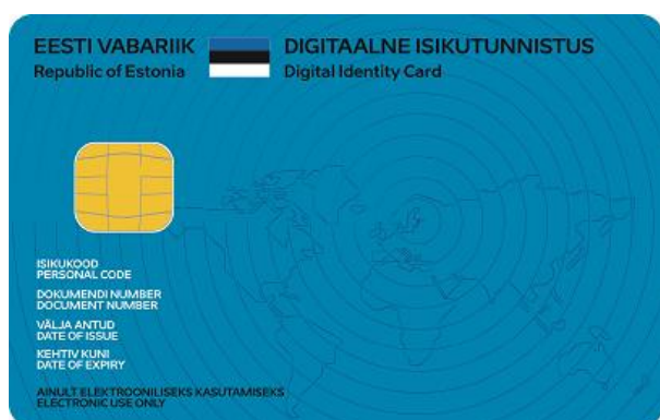
Digitaalse isikutunnistuse esikül