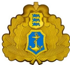
Joonis 7. Mereväe ohvitseri metallist mütsimärk