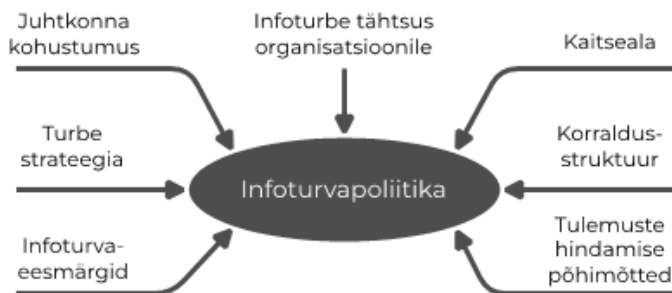
Joonis 2. Infoturvapoliitika põhilised elemendid Joonis 2 esitab infoturvapoliitika põhilised elemendid.