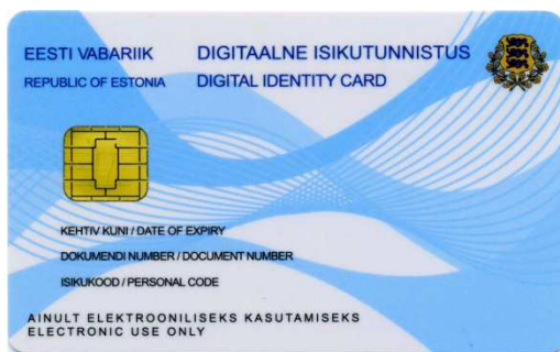
Digitaalse isikutunnistuse esikülj