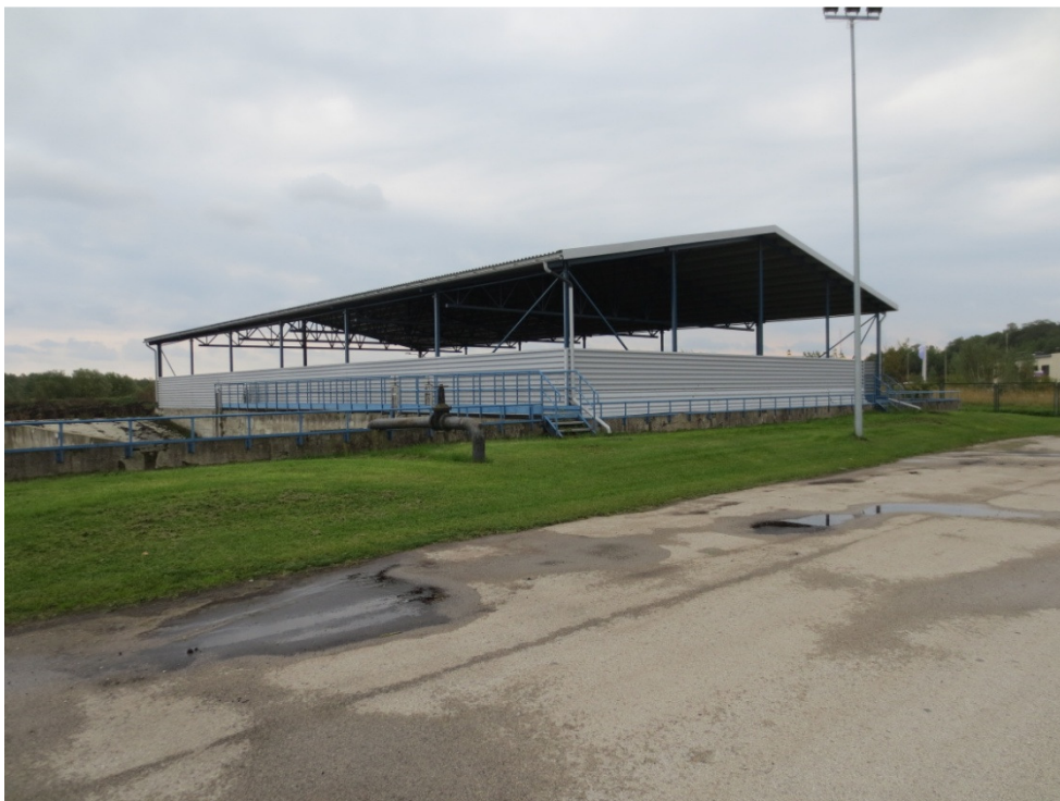
Reoveepuhasti, varjualune tugiainete hoiustamiseks

Reoveepuhastil toimub muda veetustamine tsentrifuugil, veetustatud mudatahese kuivaine sisaldus on ca 20...21%. Veetustatud muda transportimiseks komposteerimisplatsile soetati 2012. aastal nii järelkäru kui ka kopp-laadur. Komposteerimisplatsil rajati varjualune tugiainete hoiustamiseks.