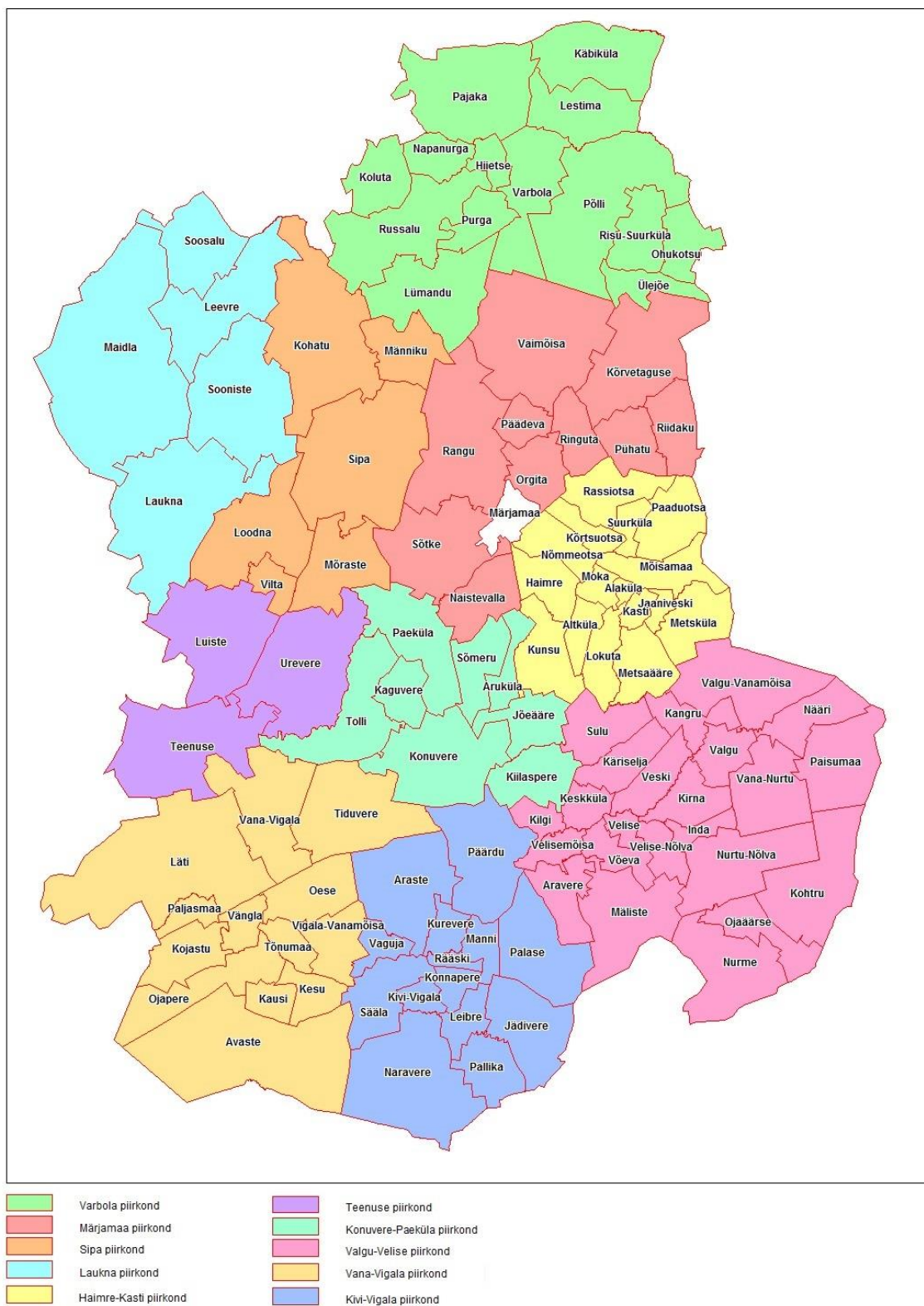
Joonis 1. Märjamaa valla piirkonnad