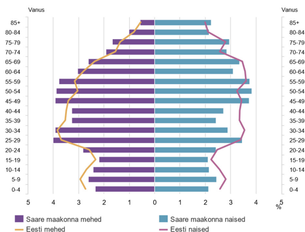
Saare maakonna rahvastikupüramiid, 1. jaanuar 2018