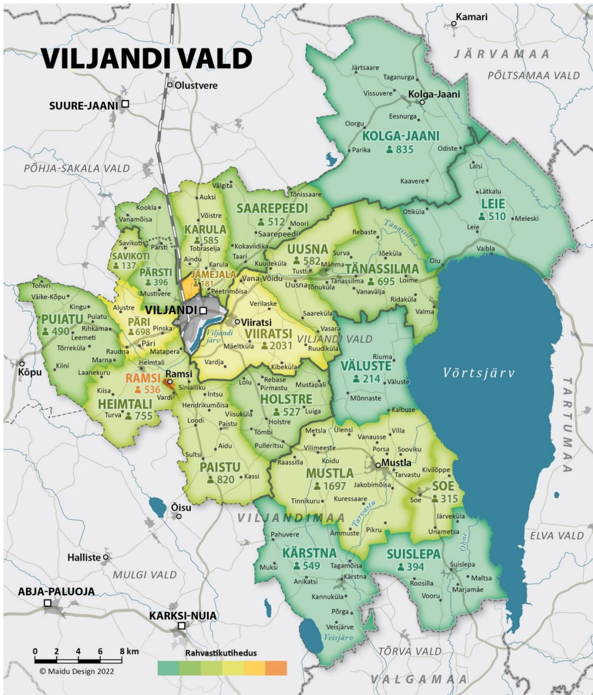
Joonis 1. Viljandi vald