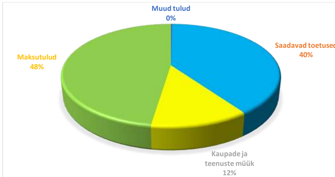
Joonis 2 Põhitegevuse tulude jaotus majandusliku sisu järgi

Üks peamisi põhitegevus tulude ja kulude languse komponente on Kõpu Hooldekodu sulgemine alates märtsist.