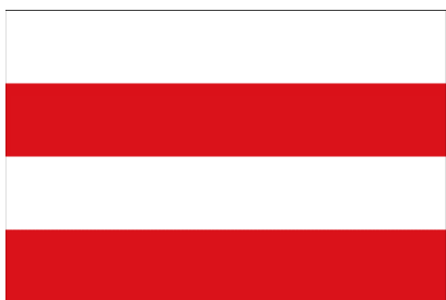
Põhja-Sakala valla lipp

Põhja-Sakala valla lipp koosneb kahest valgest ja kahest punasest vaheldumisi asetsevast võrdsest laiust. Vapp - punasel kilbil on põigiti hõbedane sõjasarv kuldsete kandevõrude, -keti ja huulikuga, selle peal on püstiasetsev hõbedase tera ning kuldse käepidemega mõõk.