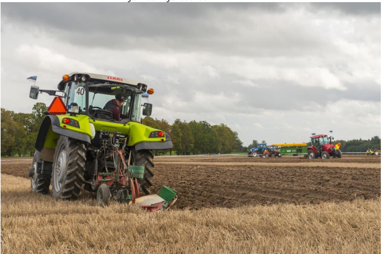
Olustvere Teenindus- ja Maamajanduskooli pildikogust

Keskharidust saab omandada Suure-Jaani Gümnaasiumis. Riigikoolina pakub kutseõppe võimalusi Olustvere Teenindus- ja Maamajanduskool.