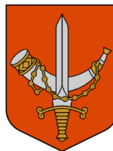
Põhja-Sakala valla vapp