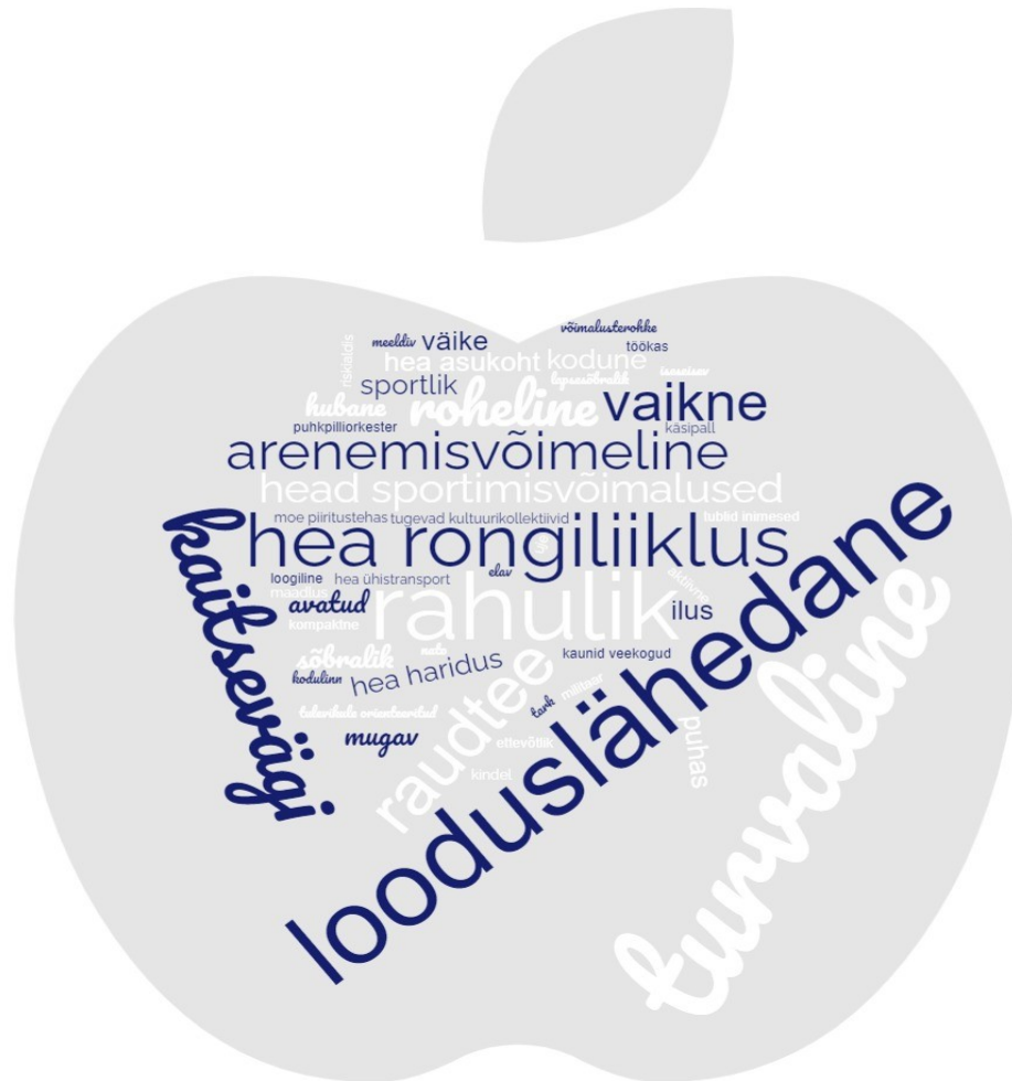
Joonis 1. Tapa vald täna märksõnades.