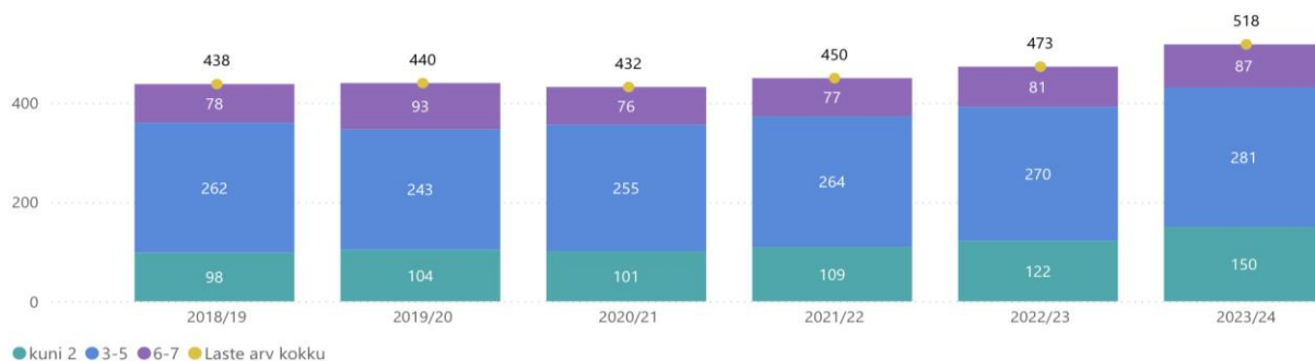
Joonis 1. Laste arv valla munitsipaal- ja eralasteaedades õppeaastatel 2018–2024.